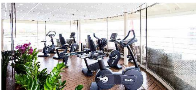
MS Nestroy, Fitnesscenter mit Panoramaaussicht