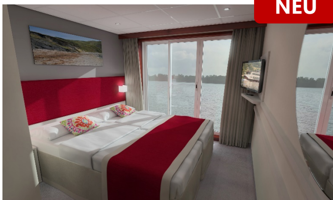
MS Nestroy, Beispielbild Doppelkabine Schiller- / Goethedeck © Illustration stinova GmbH & Design-Cell-Europe