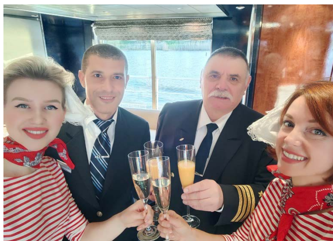
Willkommen auf der MS Nestroy