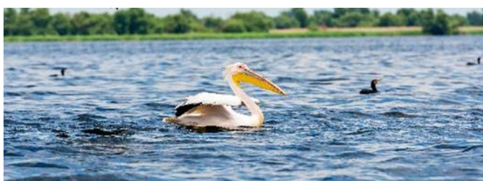
Pelikan im Donaudelta