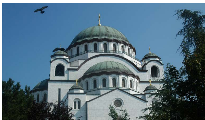
HI. Save in Belgrad