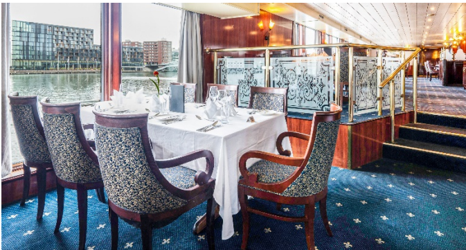
MS Aurora, Restaurant