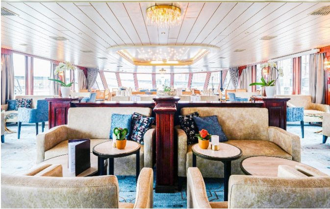
MS Aurora, Bar/Lounge